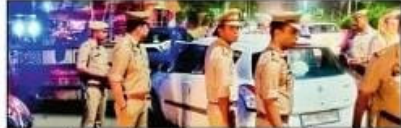
गाजियाबाद में सोमवार को जांच के दौरान दस लाख रुपये बेनामी जवाब दिए गए।